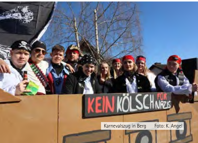
Karnevalszug in Berg