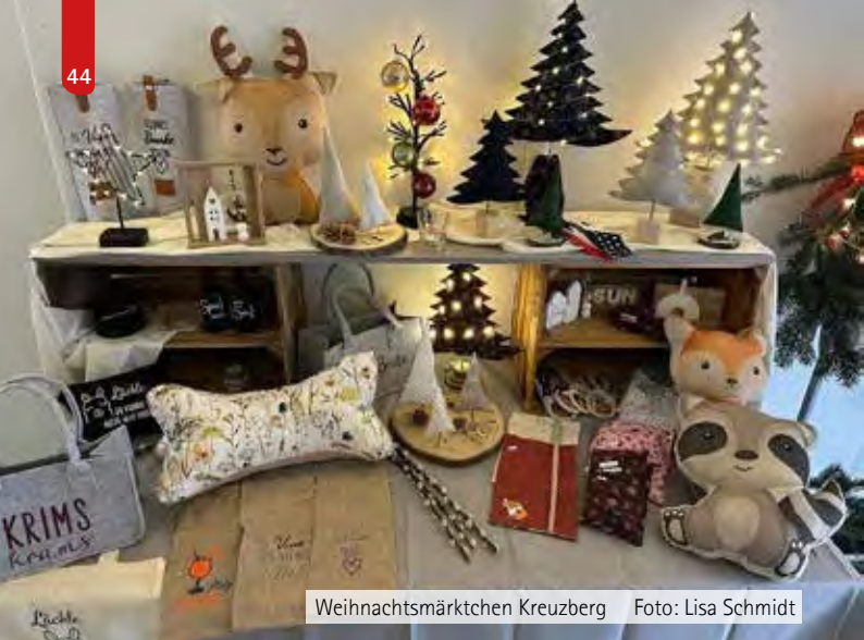
Weihnachtsmärktchen Kreuzberg