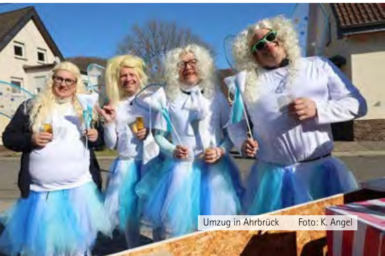
Umzug in Ahrbrück

Eintrittspreis: 10 Euro (Kinder kostenlos)