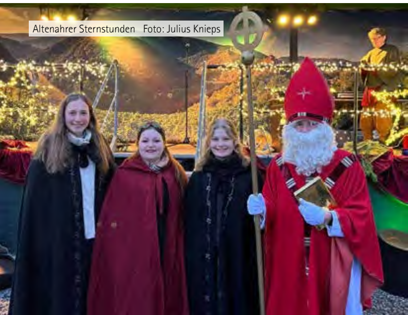
Altenahrer Sternstunden