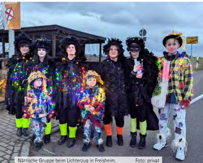
Närrische Gruppe beim Lichterzug in Freisheim.