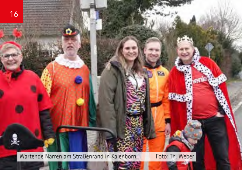
Wartende Narren am Straßenrand in Kalenborn.