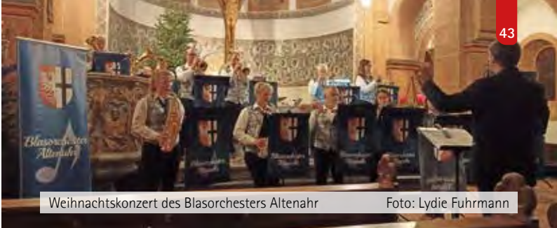
Weihnachtskonzert des Blasorchesters Altenahr