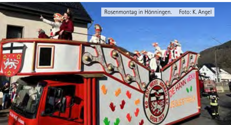
Rosenmontag in Hönningen.