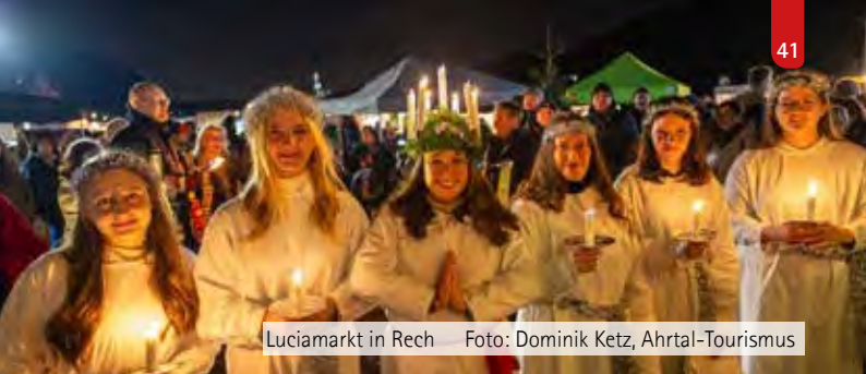
Luciamarkt in Rech