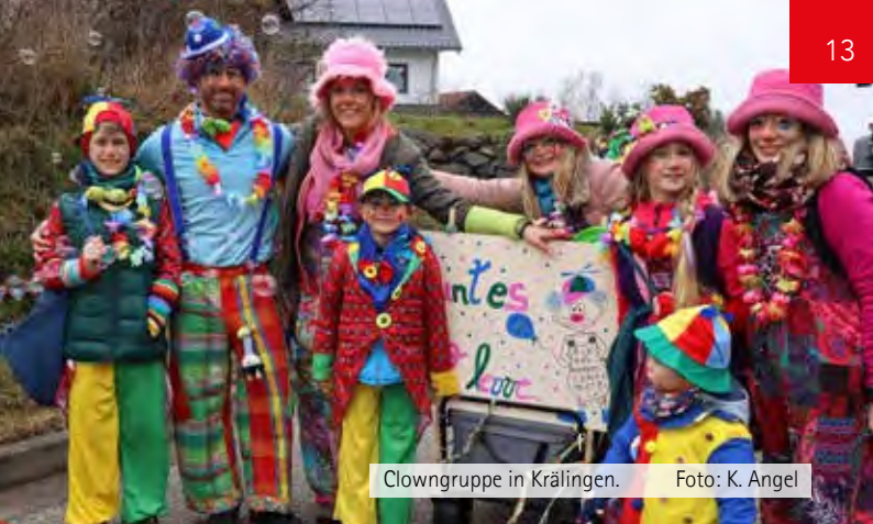
Clowngruppe in Krälingen.