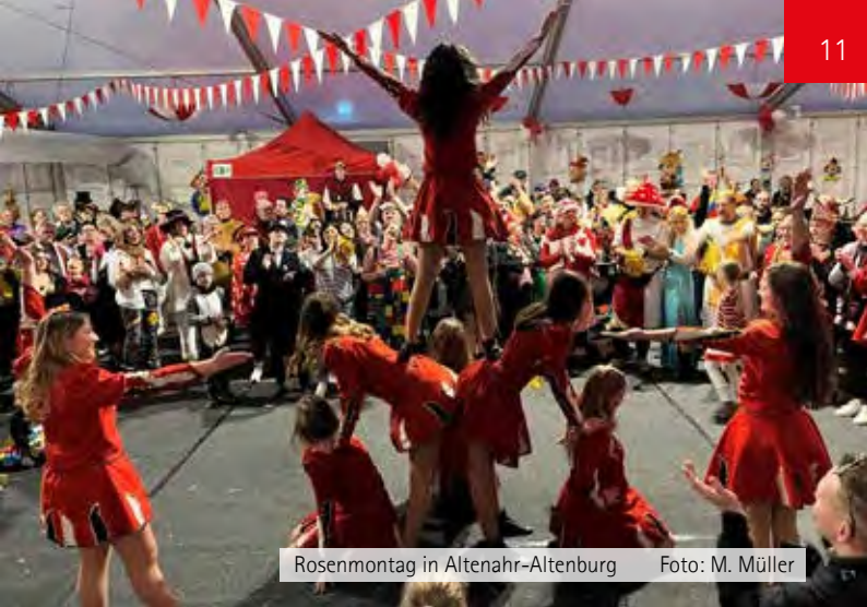
Rosenmontag in Altenahr-Altenburg