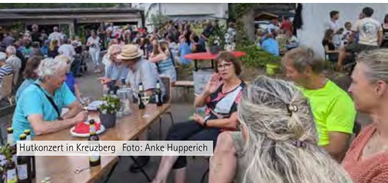
Hutkonzert in Kreuzberg