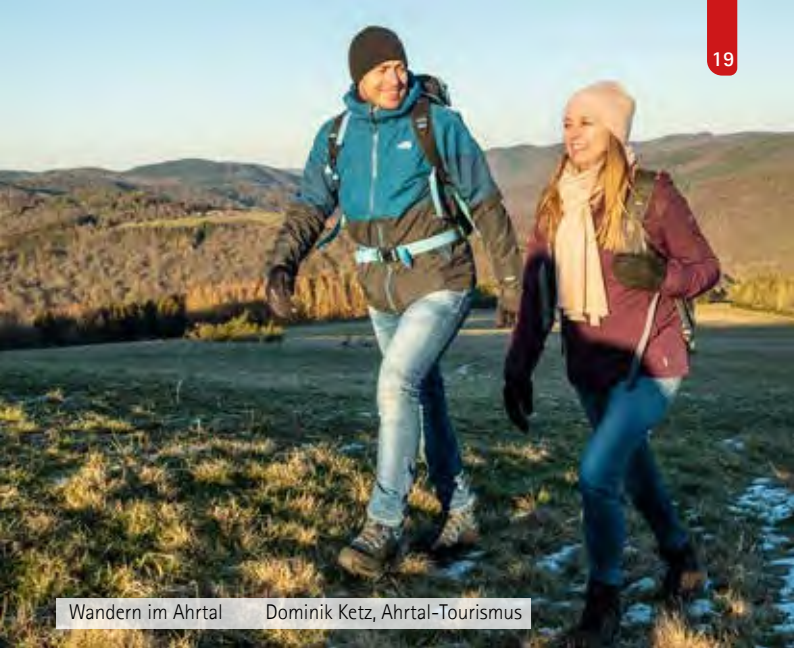
Wandern im Ahrtal