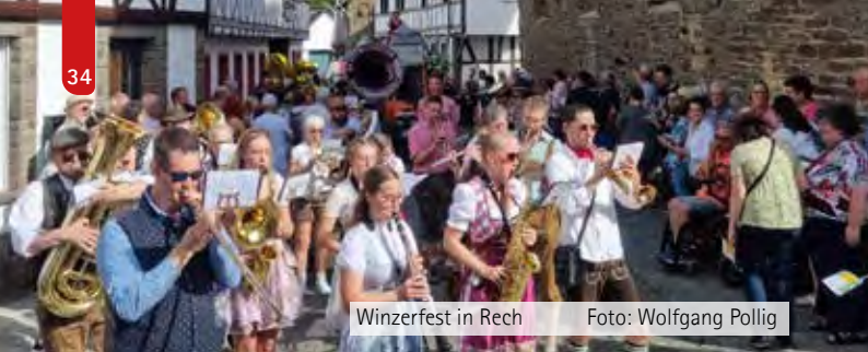
Winzerfest in Rech