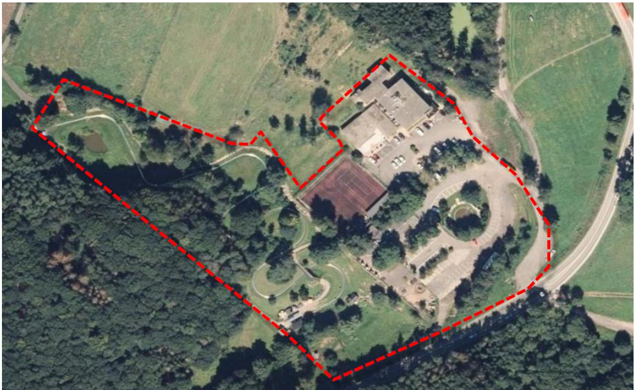
Abbildung 1: Luftbild mit Darstellung der vorhandenen Anlagen (Hotel, Sommerrodelbahn, Freizeitanlagen) – nicht parzellenscharf (Quelle: Luftbild © GeoBasis-DE / LVermGeoRP [2021] | Zugriff: 12/23 | eigene Darstellung | ohne Maßstab)