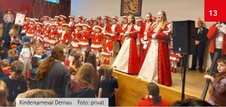
Kinderkarneval Dernaу