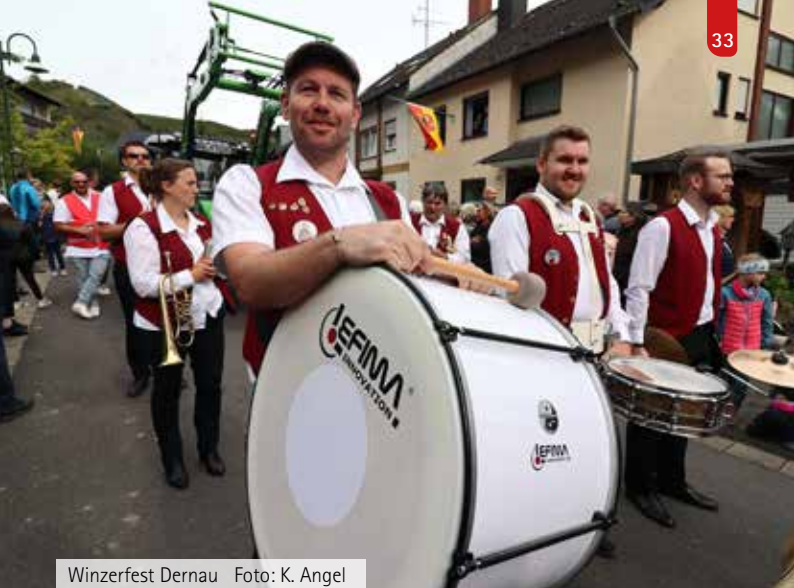
Winzerfest Derna