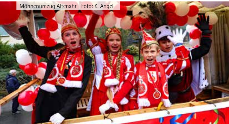
Möhneumzug Altenahr

Der Fastelovendsverein Aleburje Breiede lädt zum Rosenmontagszug mit anschließender After-Zoch-Party im Sportzelt in Altenburg ein. Zugaufstellung: Der Zugweg des letzten Jahres mit der Aufstellung Am Weiher wird auch 2025 beibehalten. Es dürfen auch weiterhin motorisierte Fahrzeuge mitfahren, wenn TÜV oder Gutachten nachgewiesen werden. Die Formulare und Informationen dazu werden nach Anmeldung zugemailt. Um frühzeitige Anmeldung an Markus Herrig wird unter mar.herrig@web.de gebeten. Die After-Zoch-Party steigt in diesem Jahr im Sportzelt in Altenburg (Am Steinacker). Die Altenburger Jecken freuen sich auf viele Zugteilnehmer, um mit ihnen den karnevalistischen Höhepunkt in den Straßen von Altenburg zu feiern. Anmeldung: mar.herrig@web.de