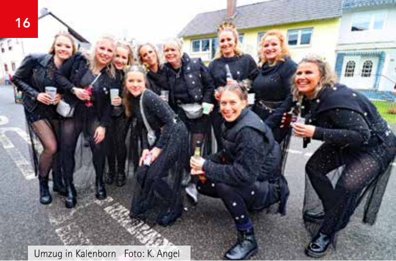
Umzug in Kalenborn