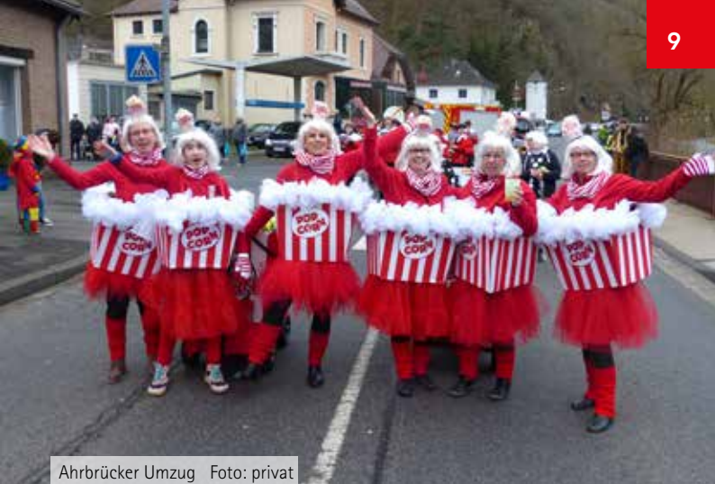
Ahrbrücker Umzug