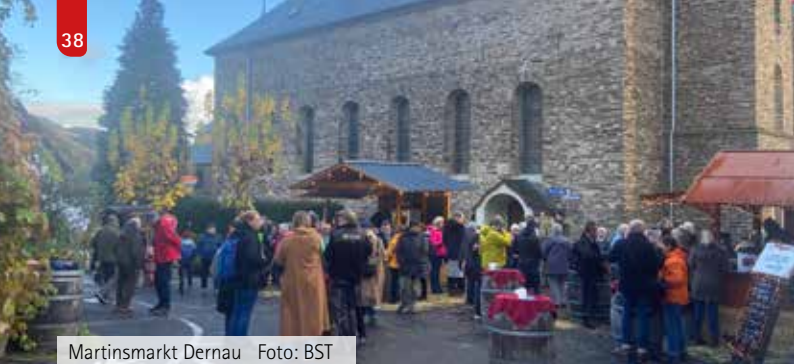
Martinsmarkt Dernau