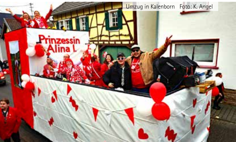
Umzug in Kalenborn