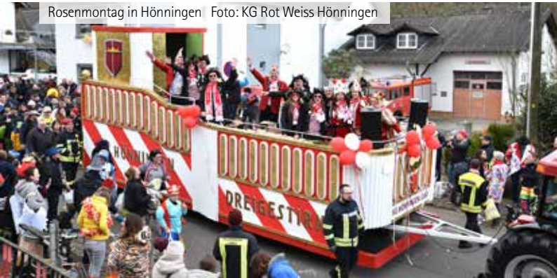
Rosenmontag in Hönningen