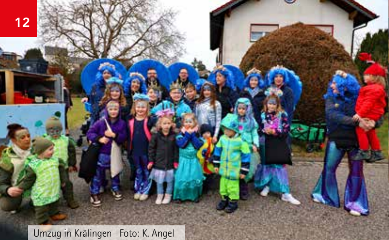
Umzug in Krälingen