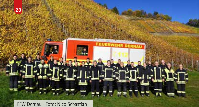
FFW Dernau