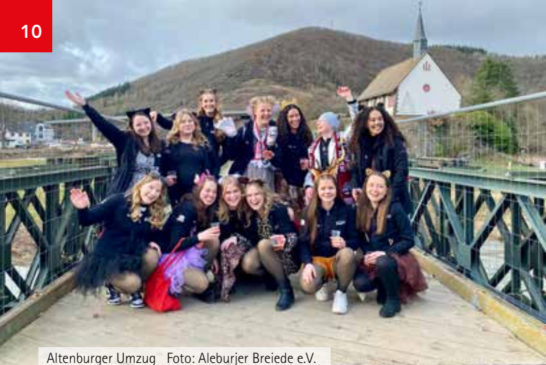
Altenburger Umzug