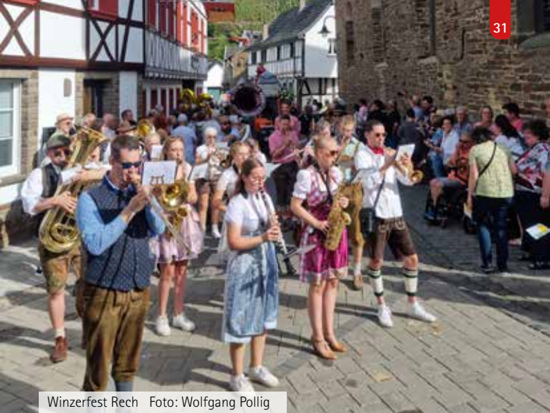
Winzerfest Rech