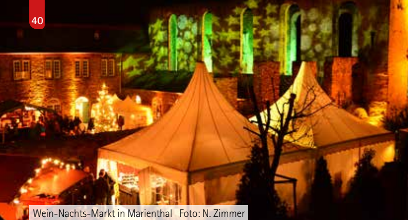
Wein-Nachts-Markt in Marienthal